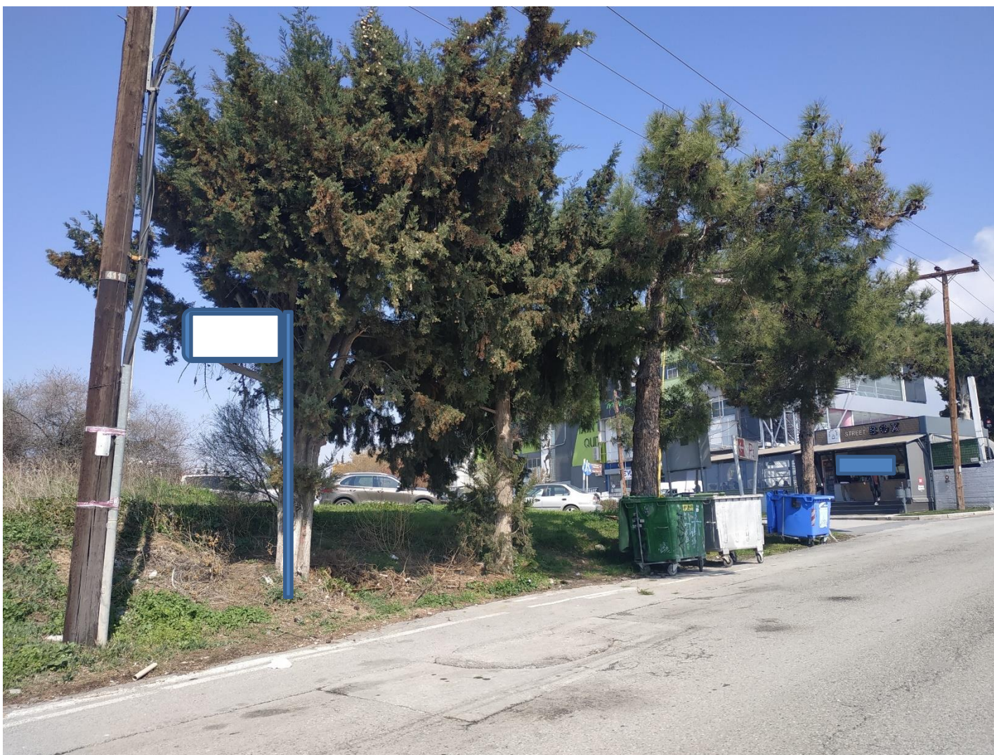
Εικόνα 2: Θέση νέας στάσης «ΚΕΝΤΡΟ ΨΗΦΙΑΚΗΣ ΚΑΙΝΟΤΟΜΙΑΣ» των λεωφορειακών γραμμών Νο 33B, 39B