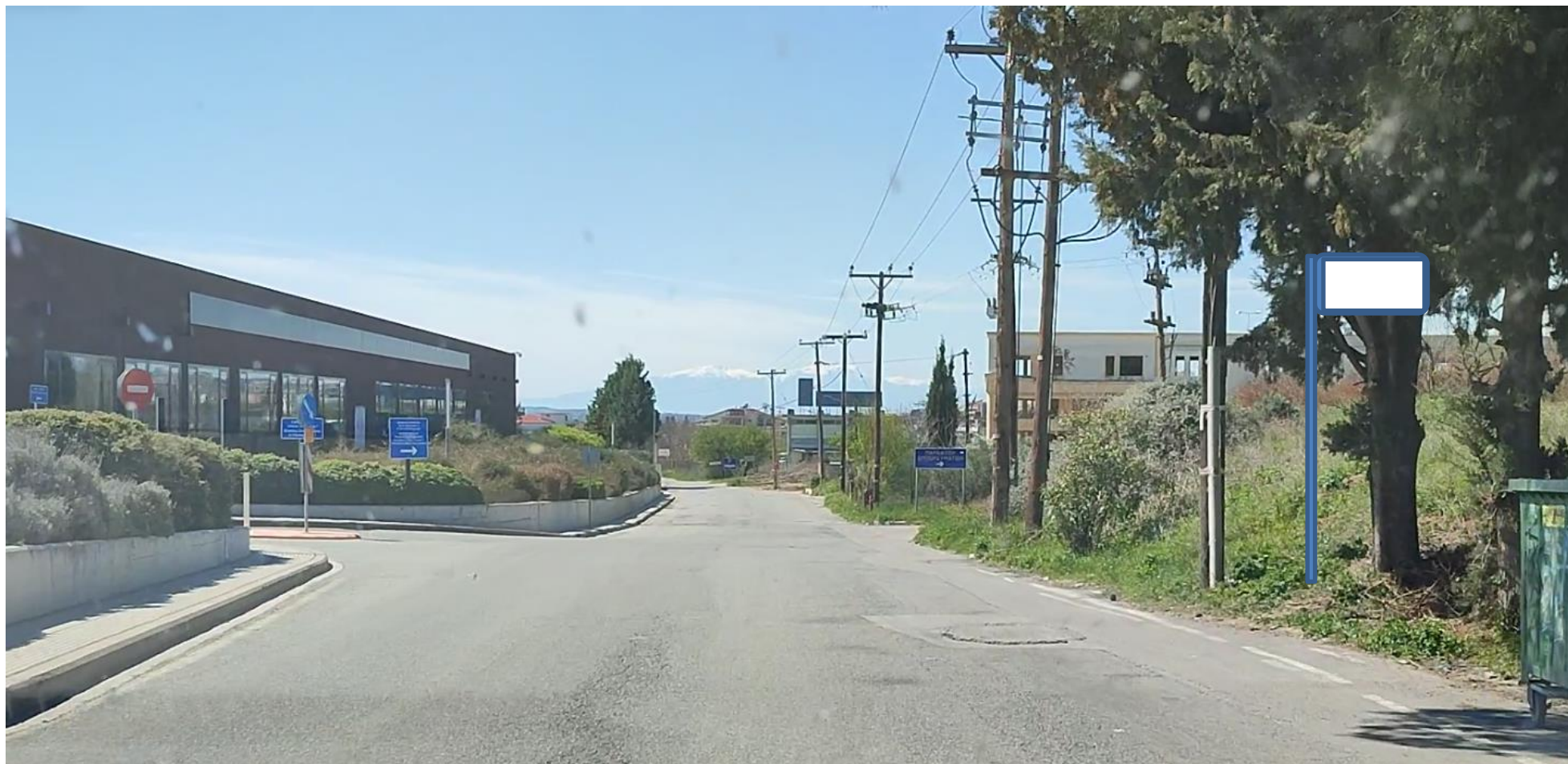
Εικόνα 1: Θέση νέας στάσης «ΚΕΝΤΡΟ ΨΗΦΙΑΚΗΣ ΚΑΙΝΟΤΟΜΙΑΣ» των λεωφορειακών γραμμών Νο 33B, 39B